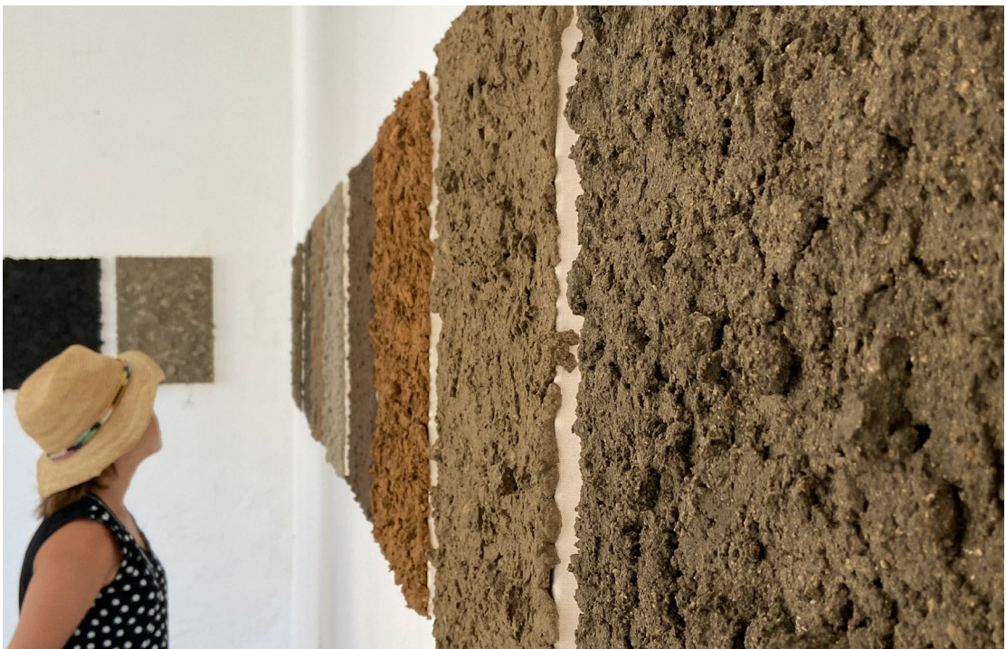
Ignacio Pérez-Jofre. Obras de la serie "tierra". Tierra sobre lienzo. 46 x 33 cm

tierra es la exposición de inicio de temporada en La Gran, que continúa con el ciclo sobre el paisaje iniciado a principios de año. En ella Ignacio Pérez-Jofre desarrolla los intereses principales que han caracterizado su trabajo –la construcción de la obra a partir del recorrido urbano, la experimentación en la pintura y el interés por la huella y los materiales encontrados–. Al usar la materia recogida en algunos puntos de la ciudad como pigmento con el que crea todos los cuadros de la exposición, el artista dirige toda la atención a la tierra –con sus cualidades de color y textura– para que por sí misma, sin más mediación, sea capaz de transmitir potencia plástica y cuestionar la tradicional idea romántica de Naturaleza, como una entidad ilimitada, invulnerable y, sobre todo, externa al hombre.