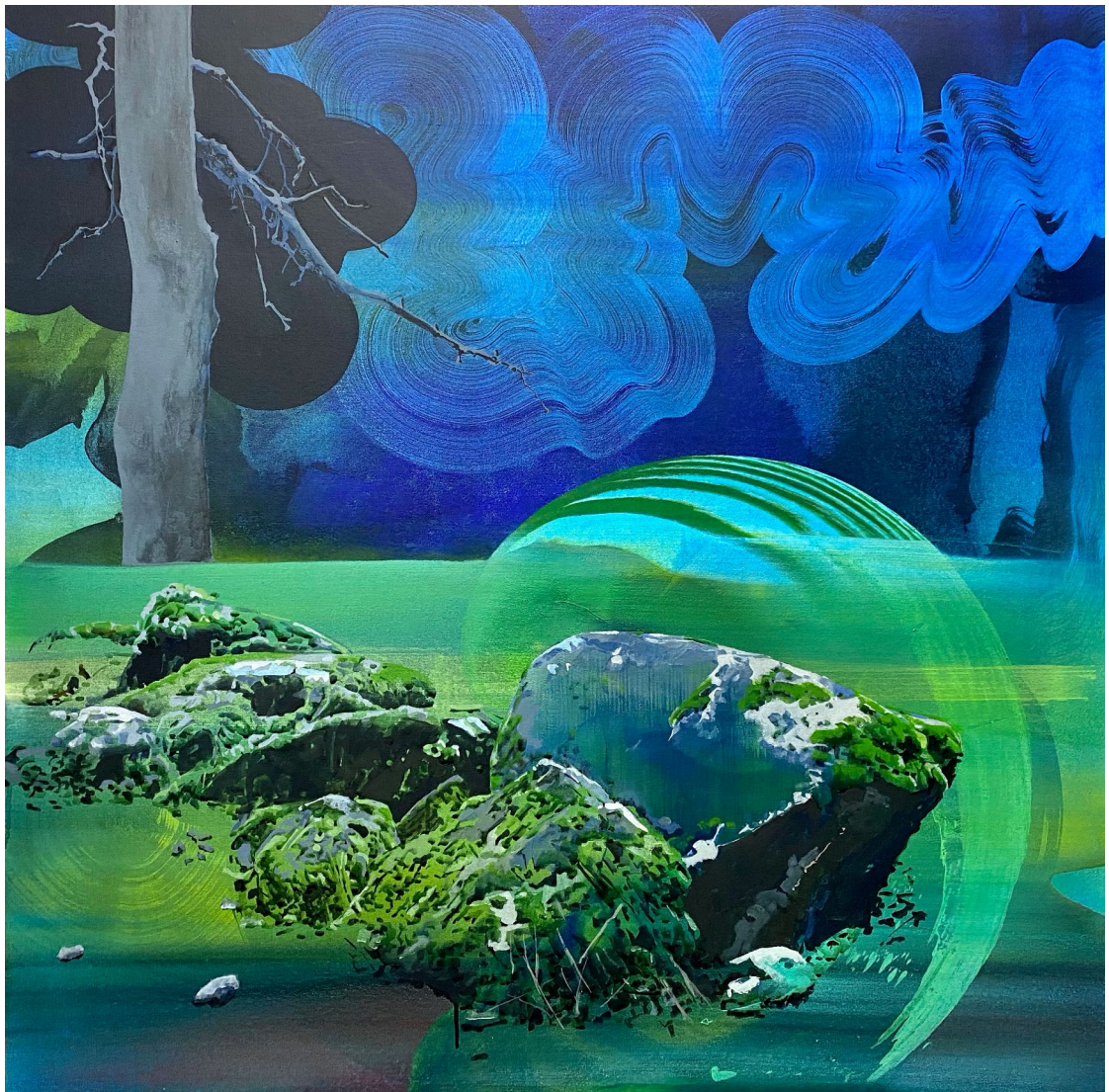
María Acuyo, de la serie "Sendero de roca y bruma", 2022. Acrílico sobre lienzo. 120x120 cm

La exposición permanecerá en la galería —Nicolás Morales 38, 1º 8B de Carabanchel en Madrid— desde el 11 de febrero hasta el 1 de abril de 2023 y podrá visitarse los jueves y viernes de 12:30 a 15:00 y de 17:00 a 20:30 h; y los sábados de 12:30 a 15:00 h.