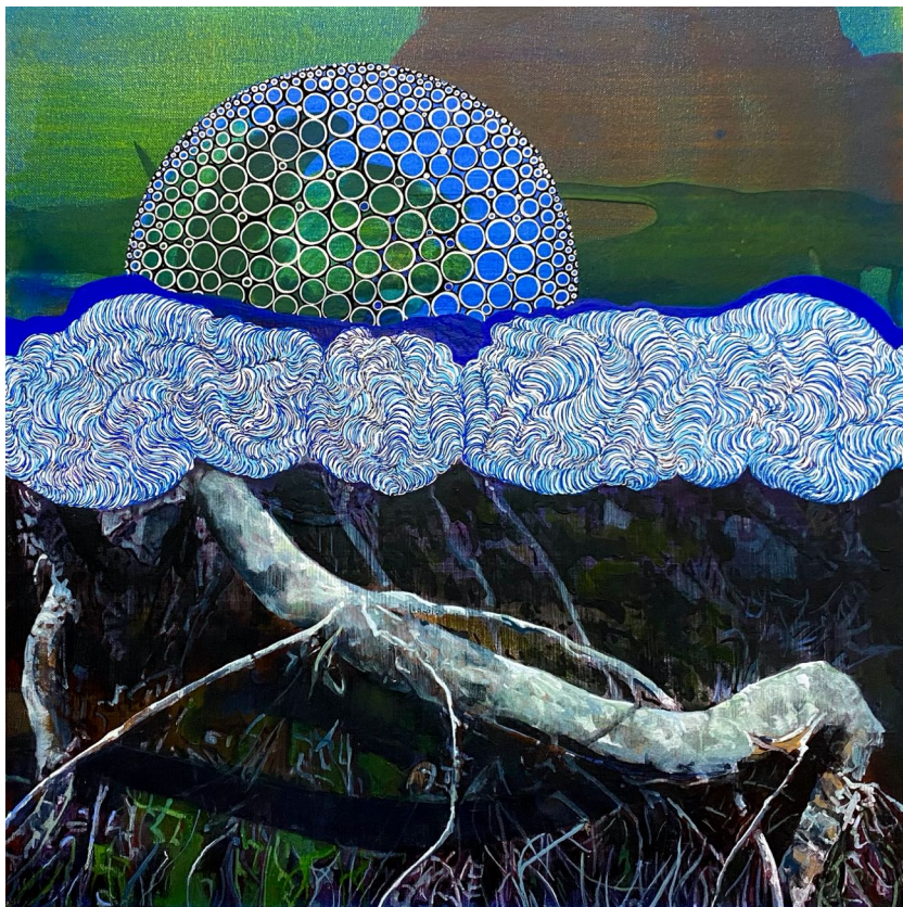
María Acuyo, “Bajo la gran cúpula”, 2022. Acrílico sobre lienzo. 50x50 cm

Como en el resto de su obra, en este proyecto María Acuyo busca la esencia de lo plástico para llegar al equilibrio en las composiciones. El sustrato que encontramos entre sus óvalos, veladuras y masas es todo un imaginario orgánico que durante años ha cultivado con una destreza técnica casi automática a partir de su formación científica. De ahí que la propia artista señale que “mi proceso de investigación se nutre de la observación de la naturaleza y de las imágenes que surgen de mi subconsciente. El tratamiento abstracto e intuitivo de la materia convive en diversas capas con un procedimiento analítico de construcción con el que intento trasladar al espectador a mundos oníricos inexistentes.”