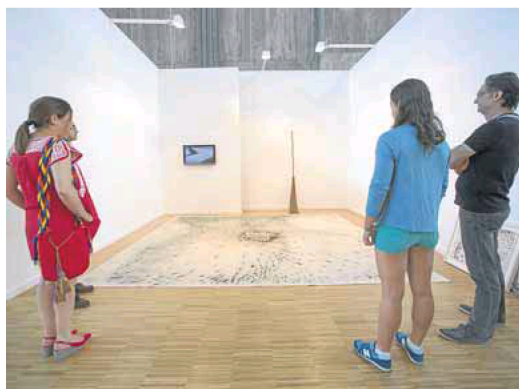
Una instalación de Valldojera preside el regreso de Sicart.

do diferentes materiales de color, evitando así el pincel y el gesto. Son destacables las propuestas de puro dibujo como las siempre curiosas escenas de Paco Pommet en My name's Lolita Art, a base de lápiz de