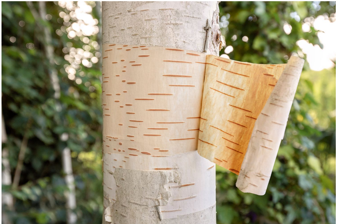
Verónica Vicente. "En verso libre", 2, 2021. Fotografía digital impresa sobre papel Hanhenmühle