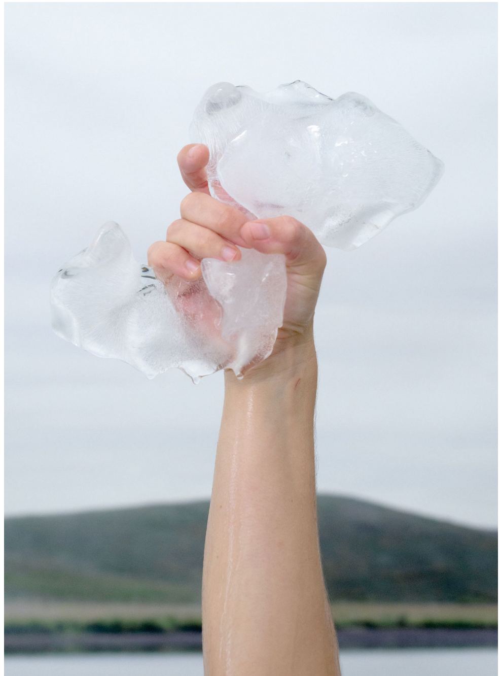
Moreno & Grau. Sin título, del proyecto "La Piel contra La Roca", 2020. Fotografía digital impresa sobre papel de algodón. Detalle.

¿Qué formas nos moldean, cuántas capas nos constituyen y a través de qué fisuras podemos explorarnos? Son cuestiones que recorren y sobre las que reflexionan las artistas, quienes a partir de un acercamiento sensible, muestran pequeños detalles que aluden a mensajes casi ocultos que proponen escuchar. Desde el aislamiento y la soledad, oscilan entre la fotografía y lo escultórico con imágenes orgánicas que terminan por constituir a las propias creadoras, entrelazadas en esta poética de la sugerencia. Composiciones muy cuidadas conmueven al espectador por sus detalles mínimos, e incluso frágiles, generando un simbolismo de formas pausadas con referencias a la ensoñación y en general al mundo sensorial.