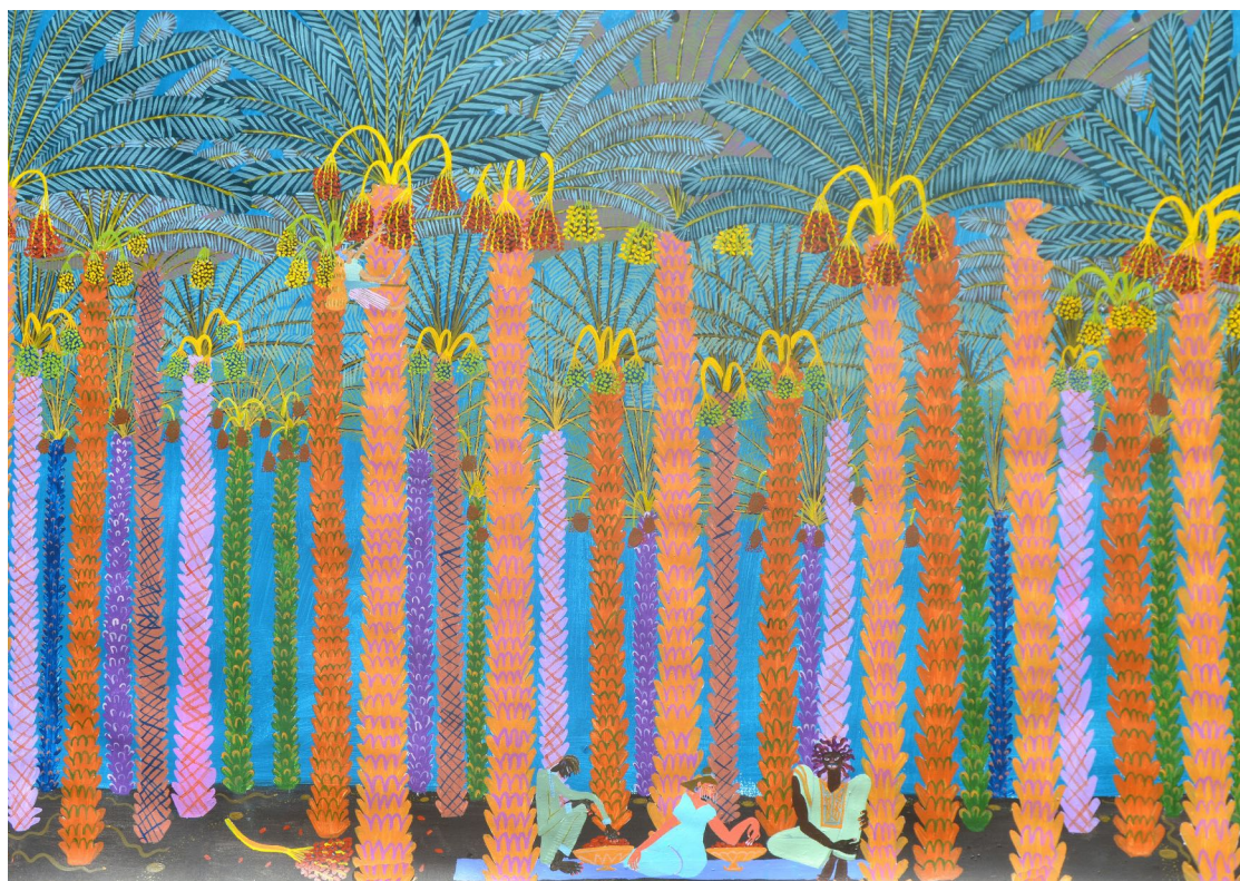
Laura López Balza. “La tarde en que comieron dátiles en un oasis de Mauritania sin salir de Senegal”. 2020. Acrílico sobre papel, 73x108 cm

“Pintar. Pintar para ver. Pintar para conocer y comprender. Pintar como registro de vivencias personales. Pintar como salida, más allá de la realidad misma. Mi obra narra mi propia experiencia vital, plasmada a través de un mundo interno compuesto de fábulas oníricas de la naturaleza y el paisaje, del medio rural o de lo cotidiano.”