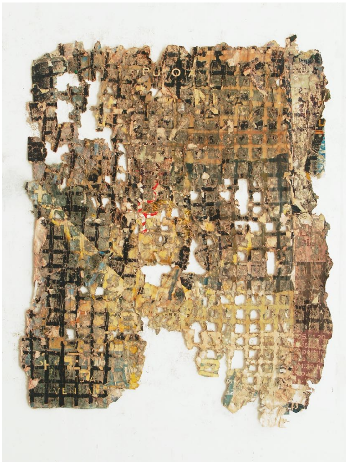
Ignacio Pérez-Jofre. Erosión, 5, 2020. Frottage sobre carteles arrancados, 105x75 cm