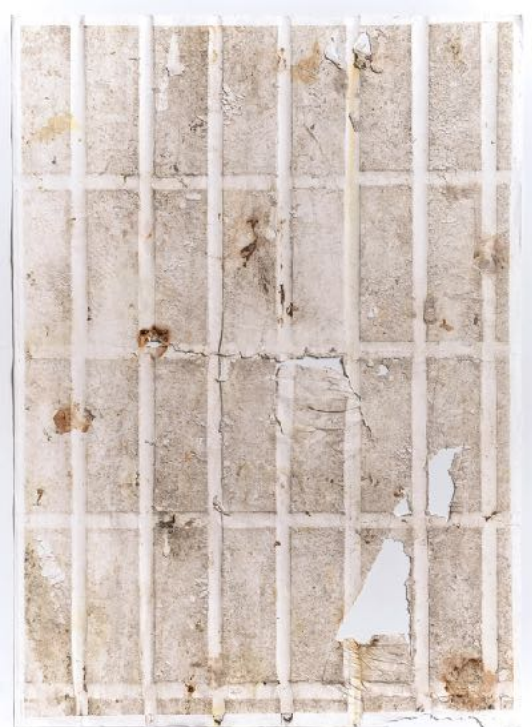
Ignacio Pérez-Jofre. "Suelos, 20 y 50", 2019. Suciedad y erosión sobre papel. Dos piezas de 84 x 59 cm