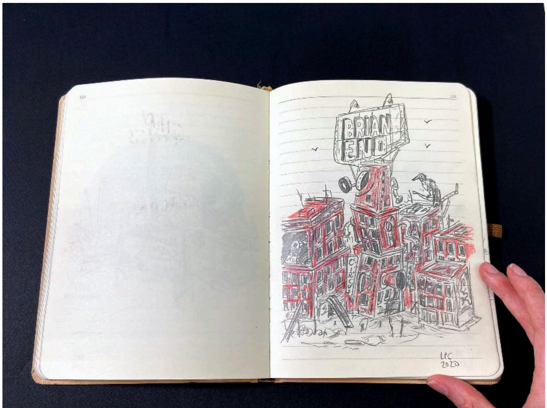
Luis Pérez Calvo. "Apocalipsis", 2020. Libro de artista. Dibujo y collage sobre cuaderno. 22 x 16 x 2 cm y 192 pp