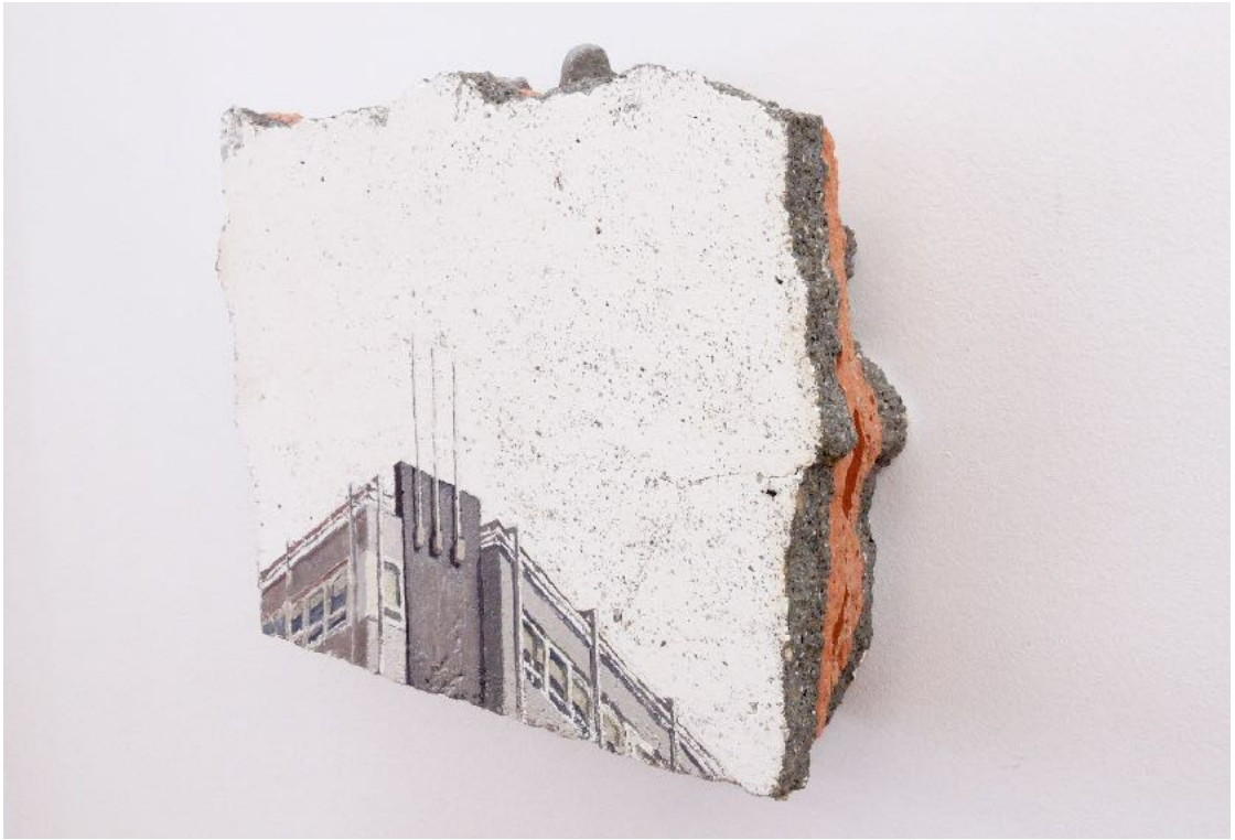
Ignacio Pérez-Jofre. "Escombros (García Barbón/Colón I)", 2014. Óleo sobre soporte encontrado (yeso, cemento y ladrillo). 20 x 28 x 6 cm