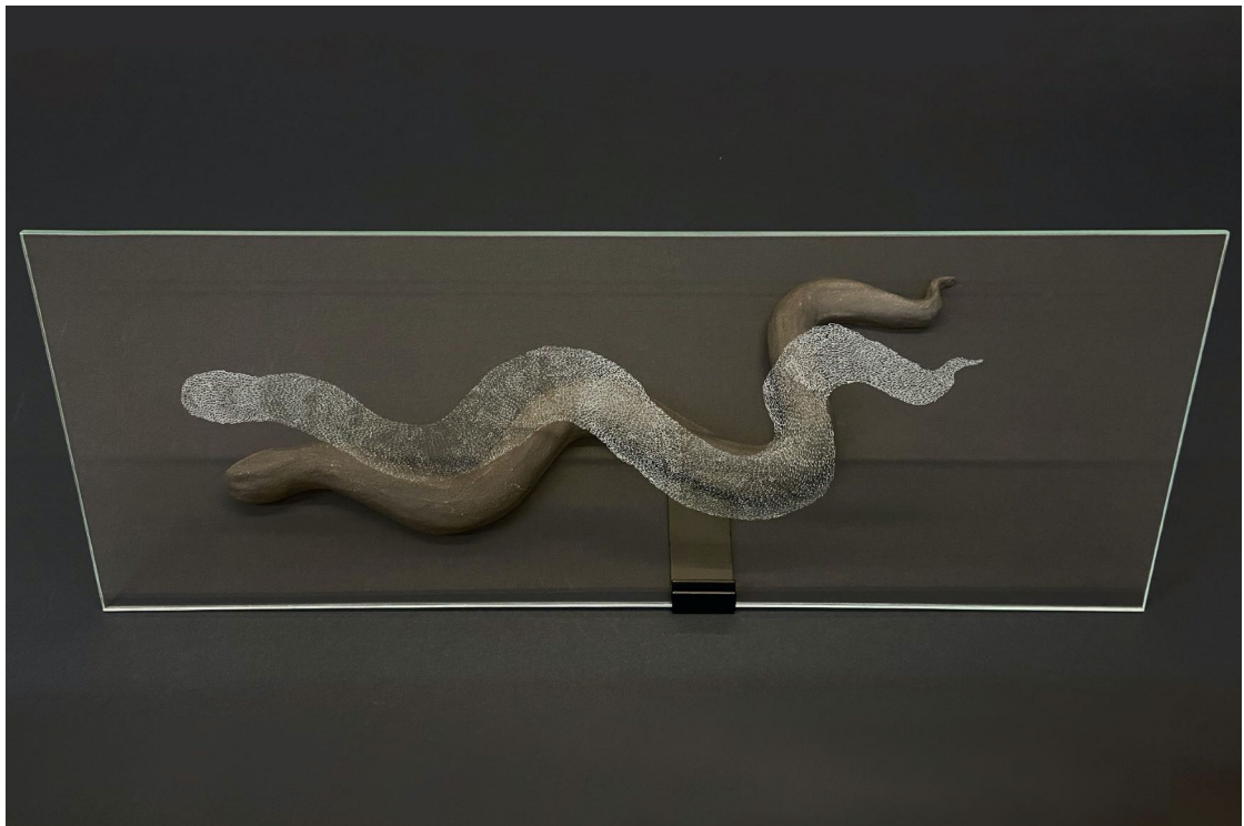
Moreno & Grau, "Sin título", 2020. Escultura de arcilla negra cocida a alta temperatura y cristal tallado a mano. 65x23x23 cm.

Juan Baraja presenta un proyecto fotográfico –Hipódromo– donde reconstruye un relato en el que –por primera vez en su trabajo– el paisaje exterior, los sujetos y objetos que lo contextualizan y dan vida, se alzan con fuerza, utilizando la luz como material constructivo de un paisaje urbano y subjetivo. Frente al recorrido de las artistas anteriores en sus trabajos, aflora cierta detención o quietud, lo que es un movimiento leve pero sugerente que logramos entrever entre lo revelado y lo oculto. Lugares con tal peso escultórico que ejercen un gran poder de atracción en nosotros y que lejos de adentrarse en nuestra retina, componen arquitecturas que permanecen eternamente en nuestra dimensión soñada o imaginada.