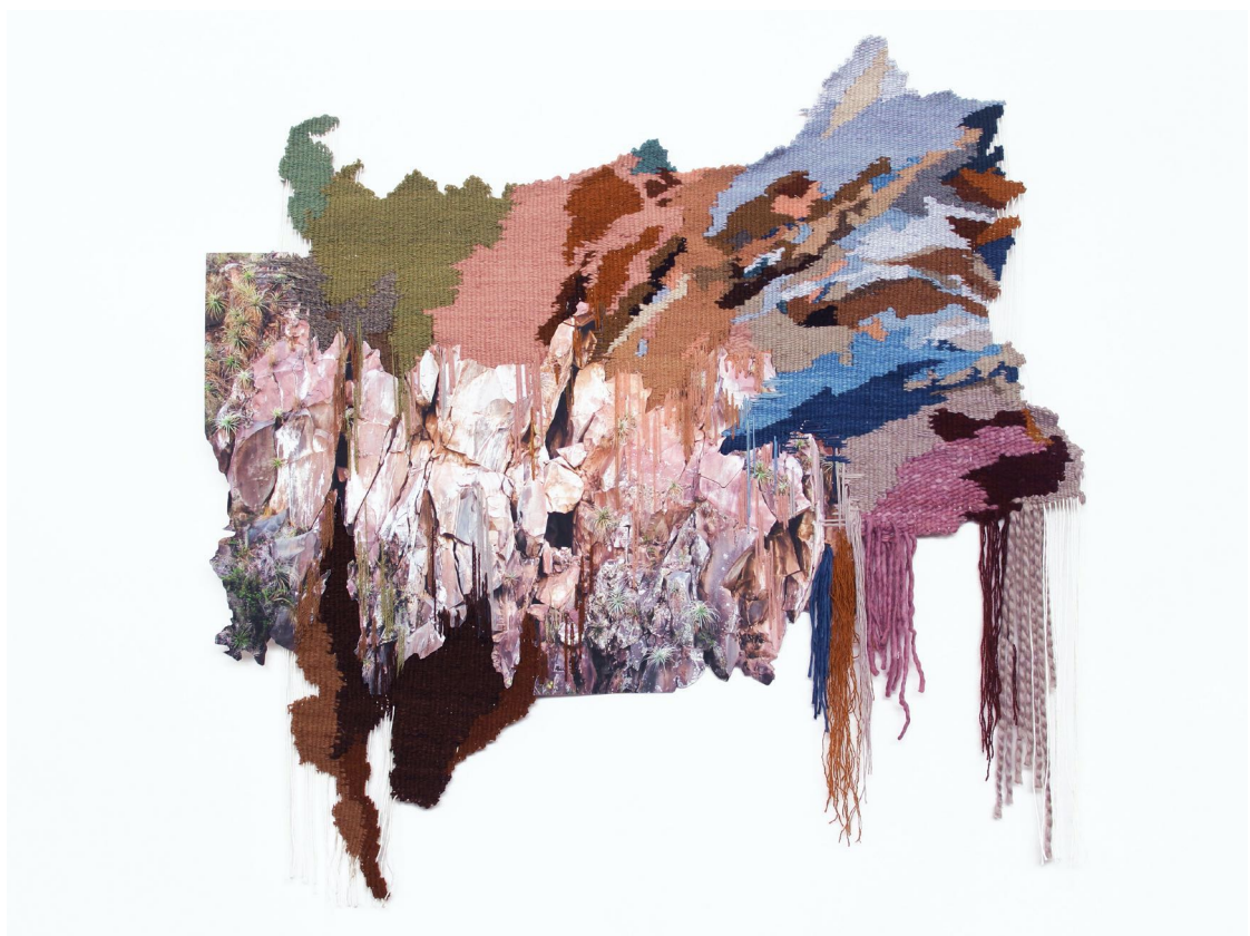
Ana Teresa Barboza. “Capas del paisaje”, 2019. Fotografía digital en papel de algodón y tejido en hilo de algodón, oveja y alpaca. 100x98cm

Edición especial de ESTAMPA 2021. Ifema Feria de Madrid. Pabellón 6, Stand 6B23