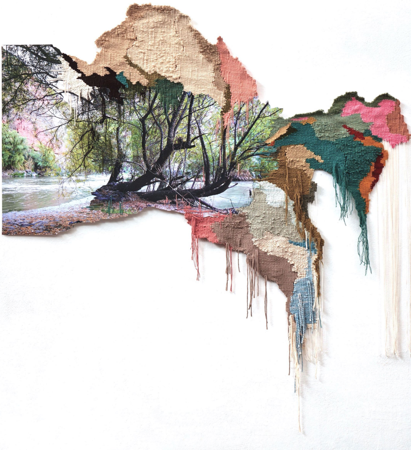
Ana Teresa Barboza. "Vilcanota", 2019. Fotografía digital en papel de algodón y tejido en hilo de algodón, oveja y alpaca. 135x134 cm