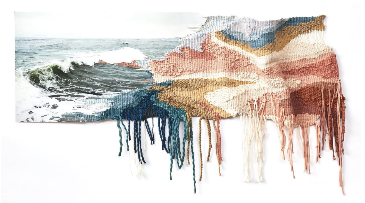
Ana Teresa Barboza. "Punta Roquitas", 2019. Fotografía digital en papel de algodón y tejido en hilo de algodón. 47x92 cm

JUSTMAD 2020. Palacio Neptuno. Calle de Cervantes, 42, Madrid. Stand V22