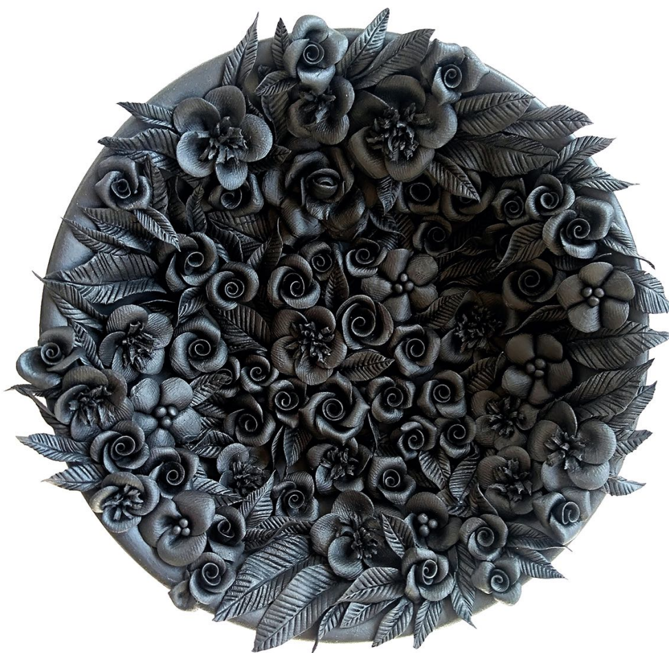
Noemí Iglesias, "Artificio". 2020. Porcelana con pigmento negro de alta temperatura. Técnica floral hecha a mano y cocida a 1400 °C. 14x14x4 cm