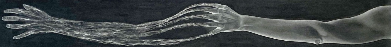
Marina Núñez, Sin título de la serie "Ciencia Ficción", 2000. Óleo y esmalte sobre lienzo, 56x192 cm