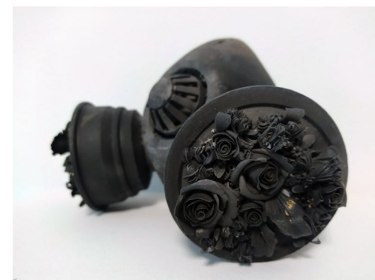
Noemi Iglesias Barrios Quarantine (Máscara II) Técnica floral hecha a mano. Porcelana y cocción de humo con carbón en caja refractaria a 1270 °C 22 x 19 x 9 cm P.V.P - 2.400 € con peana 2300 € sin peana