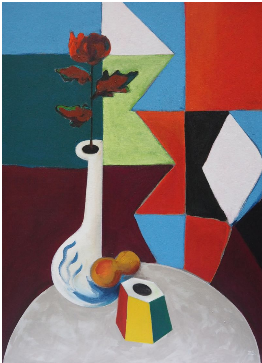
Job Sanchez Sin título. Après MB, 2021 90 x 65 cm Acrílico y guache sobre tela P.V.P - 1.500 €