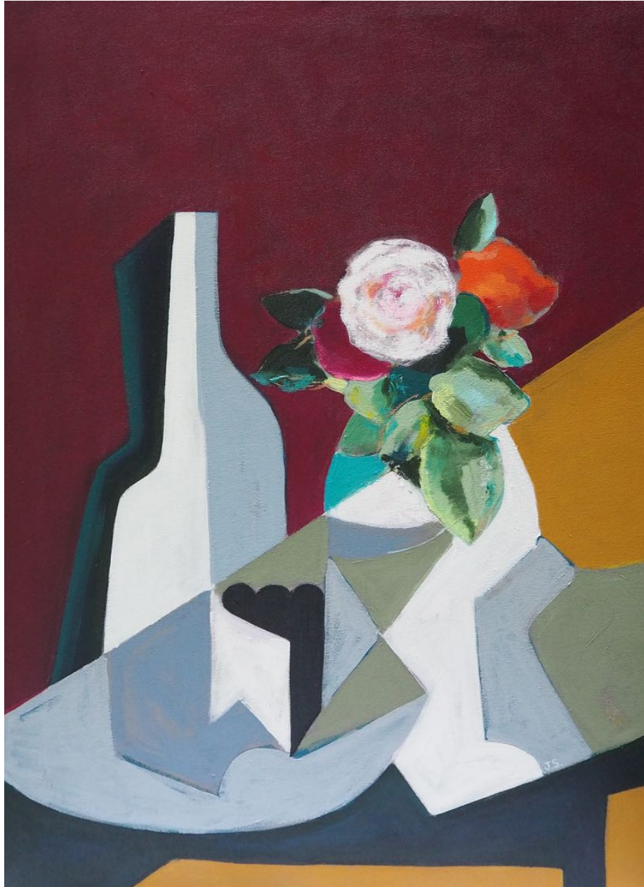
Job Sanchez Sin título. Après MB, 2021 90 x 65 cm Acrílico y guache sobre tela P.V.P - 1.500 €