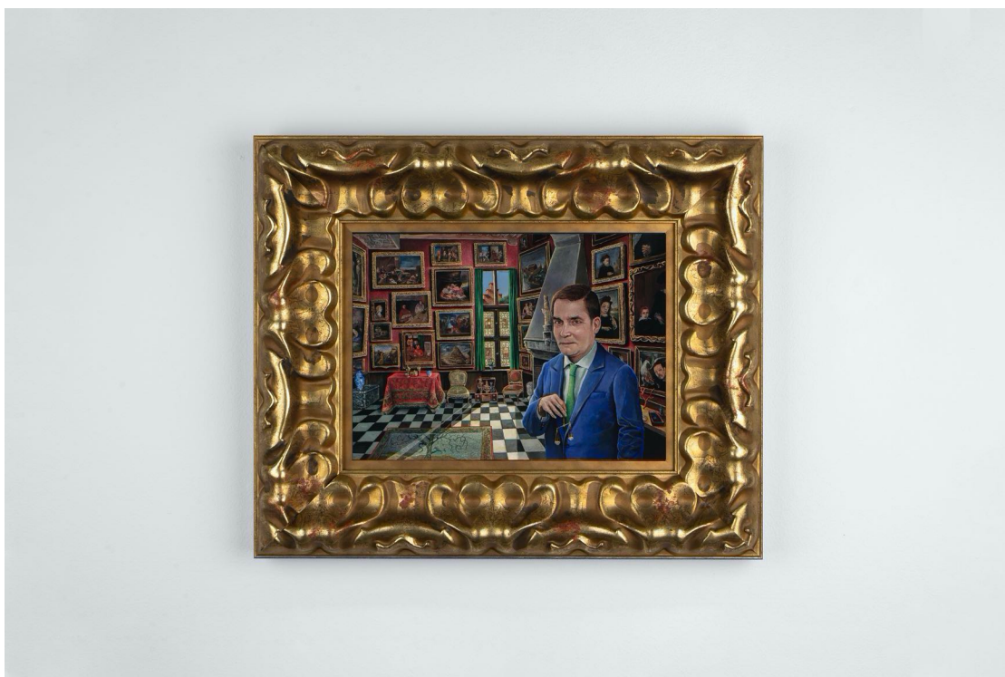
Enrique Marty. Sin título, 2021. Óleo, témpera y acuarela sobre madera. 25x34 cm

ESTAMPA 2021. Ifema Feria de Madrid. Pabellón 3, Stand 3B23