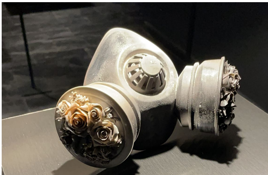
Noemí Iglesias. "Quarantine", 2019. Máscara de porcelana cocida en caja refractaria con carbón a 1280°. 23 x 18 x 10 cm